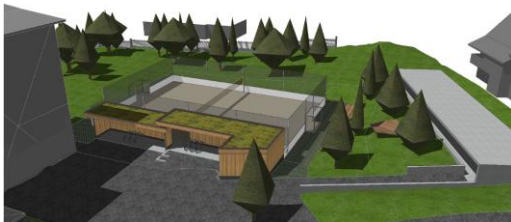
Abbildung 1: Umgebungsplan

Das Kleinspielfeld wird auf der vorhandenen Rasenfläche westlich vom Schulhaus Feld 1 platziert. Der vorhandene Baumbestand ist nicht tangiert und bleibt bestehen. Angrenzend an das Kleinspielfeld wird ein multifunktionaler Unterstand angebaut, welcher Platz für Spielgeräte und Sitzgelegenheiten bietet. Im Unterstand auf der Ostseite werden die Mofas parkiert.