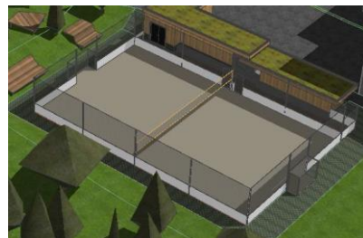
Abbildung 2: Kleinspielfeld