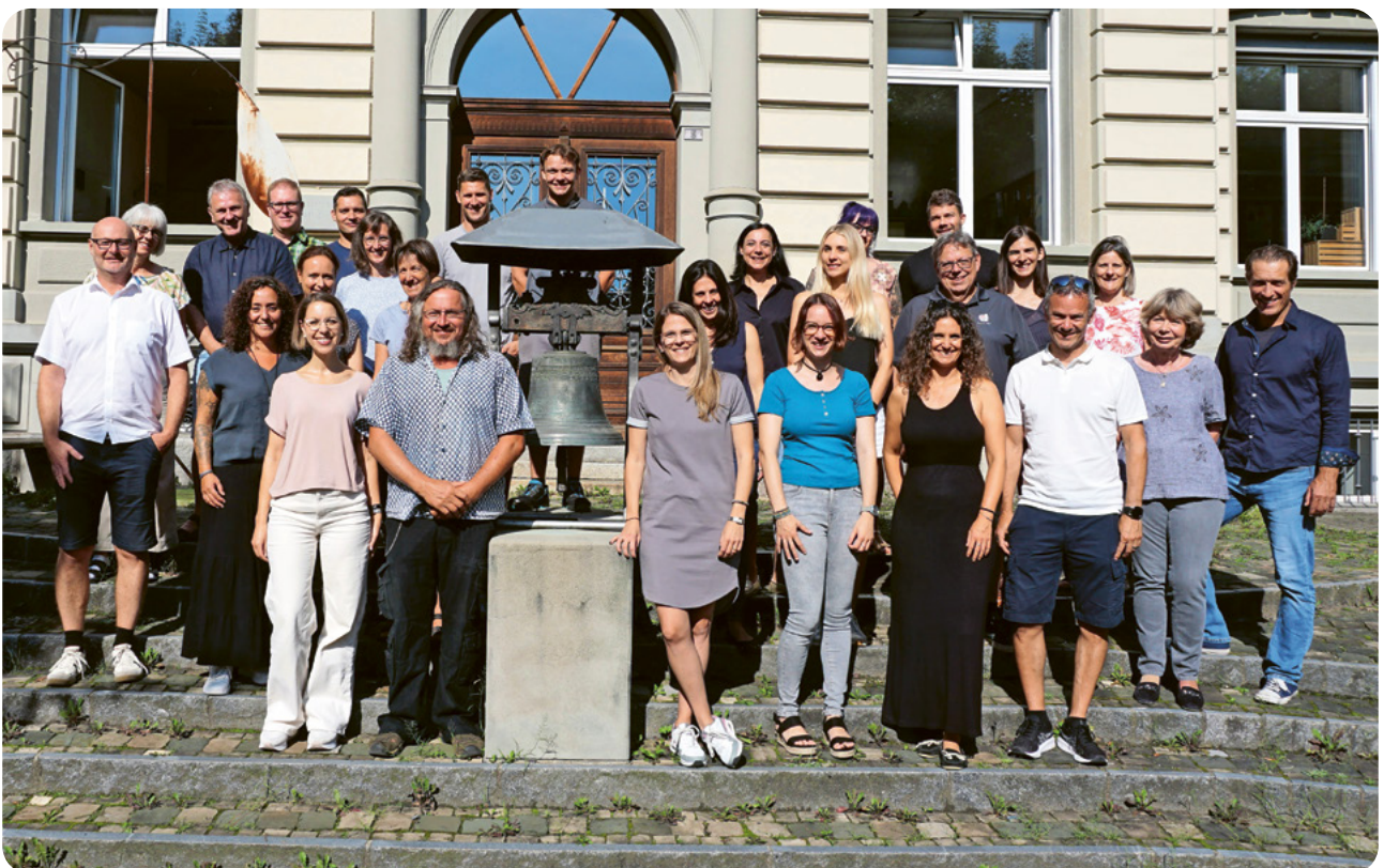
Team Schuleinheit Feld