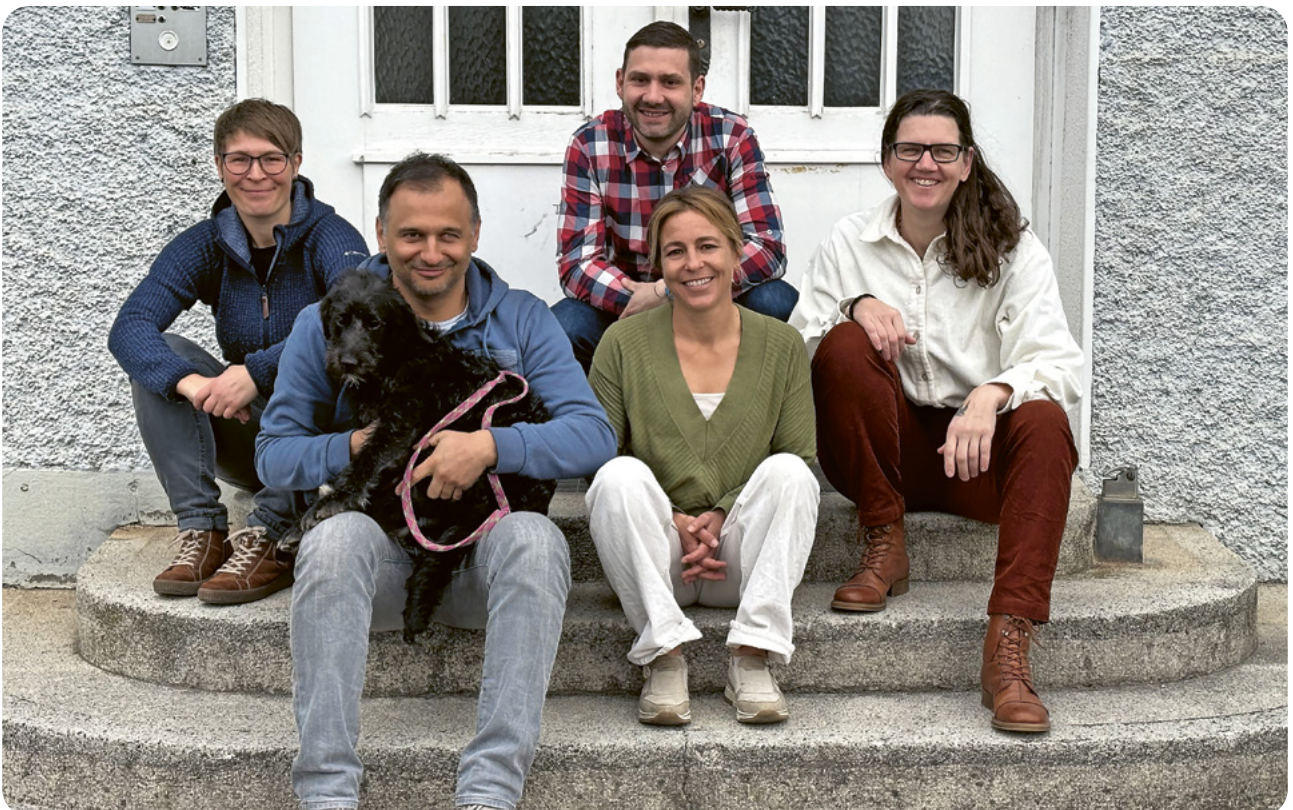
Team Regionale Kleinklasse