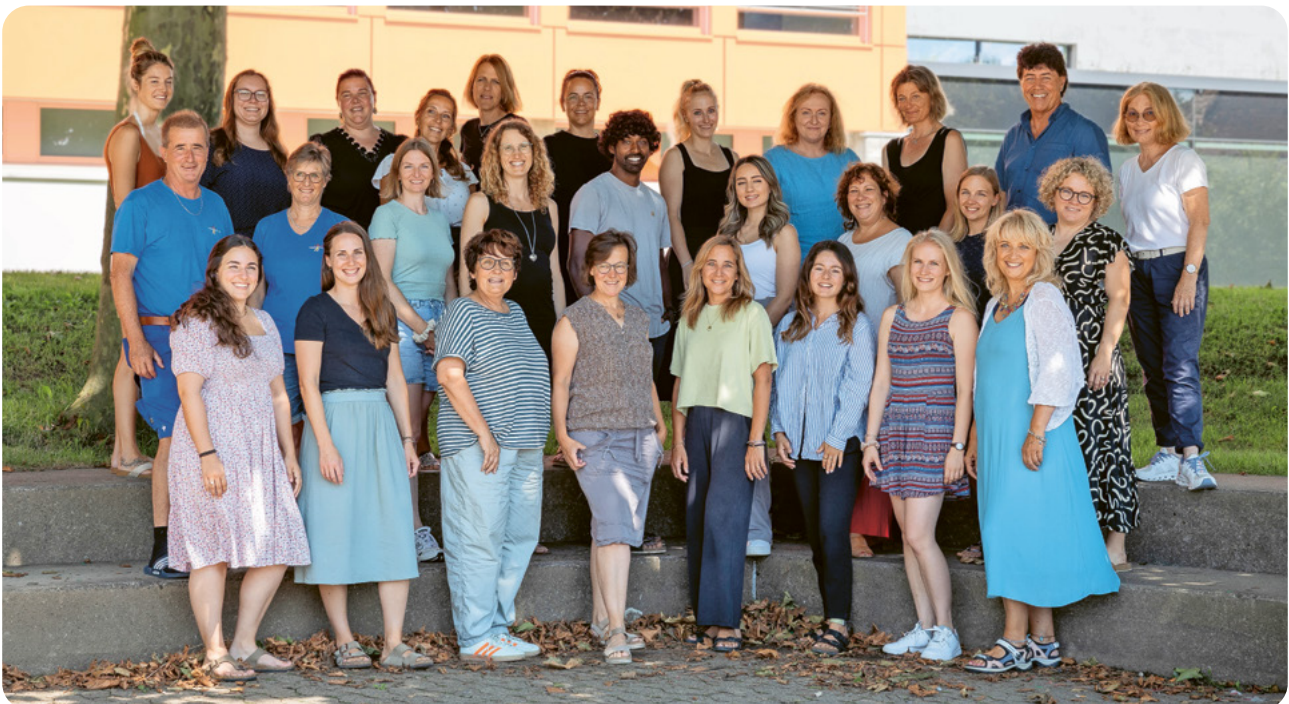
Team Schuleinheit Schöntal